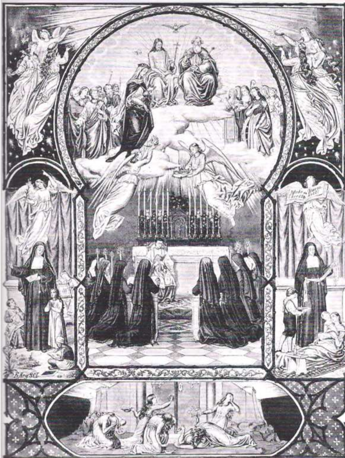
Profesión religiosa de Hermanas