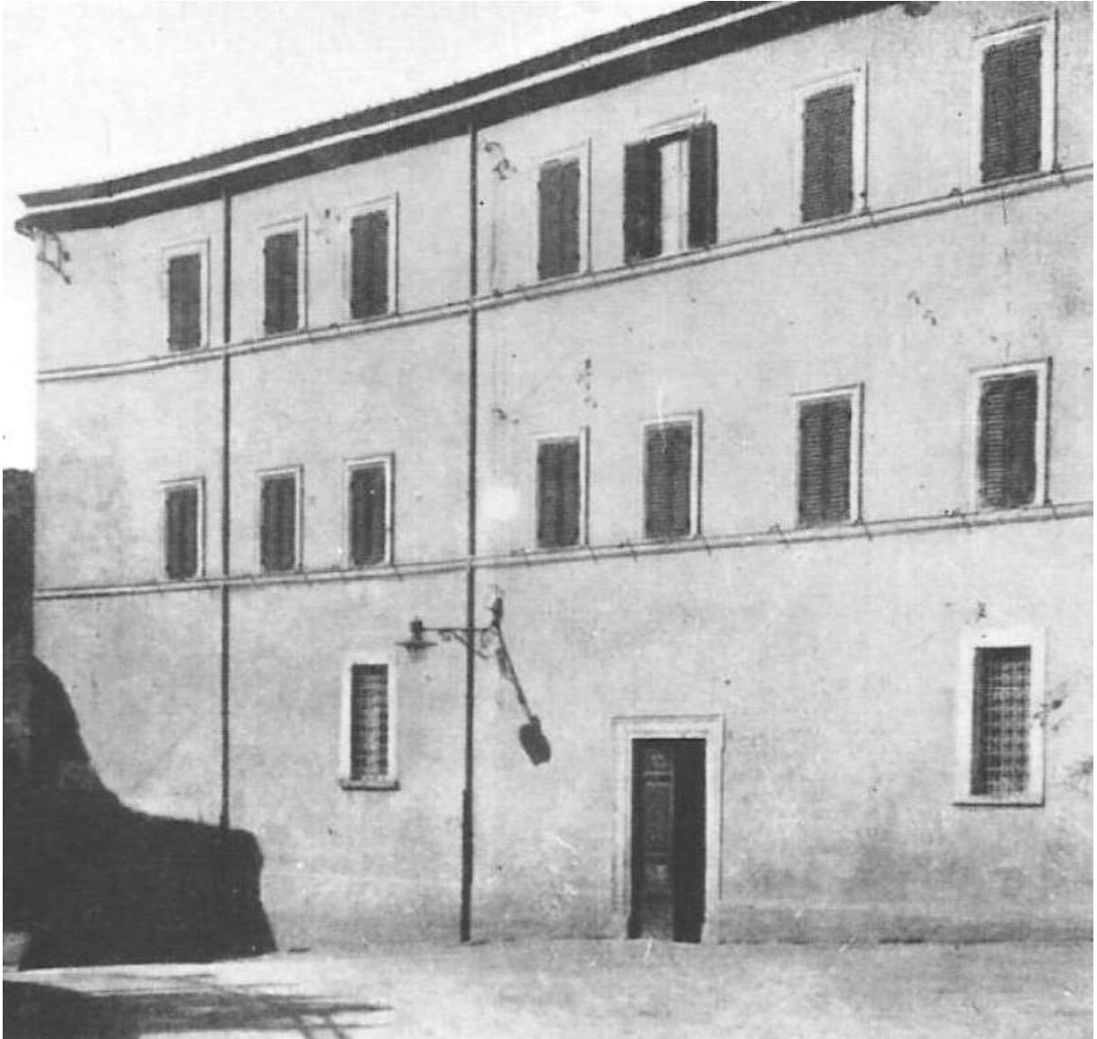
Tívoli. Primer Hogar (Ersters Heim)