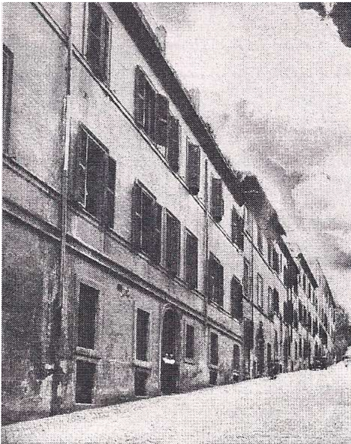
Casa Madre. Salita Sant'Onofrio. 1903