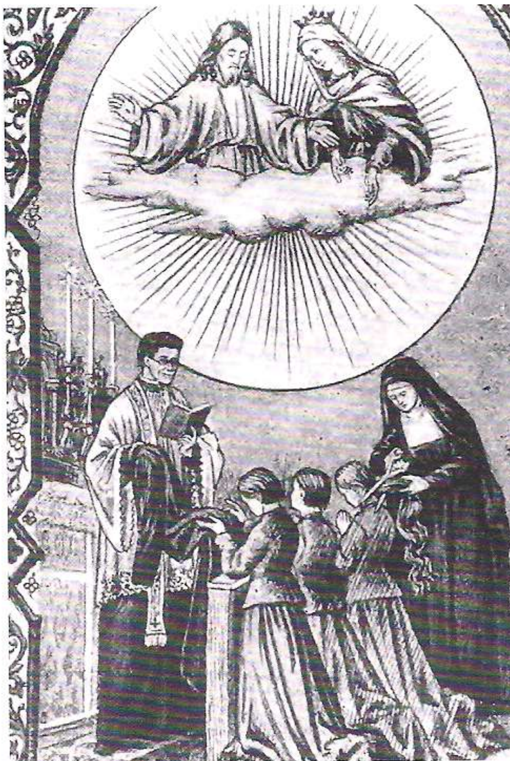
Toma de hábito para novicias