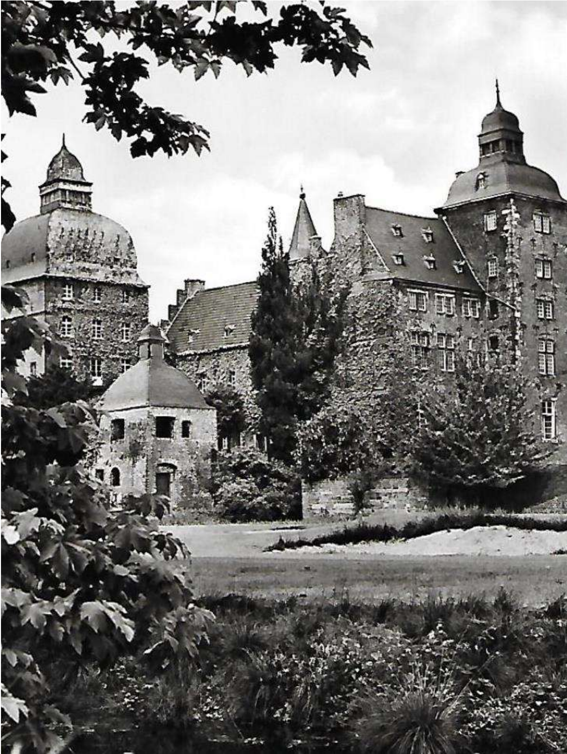
Castillo. Neuwerk, Alemania