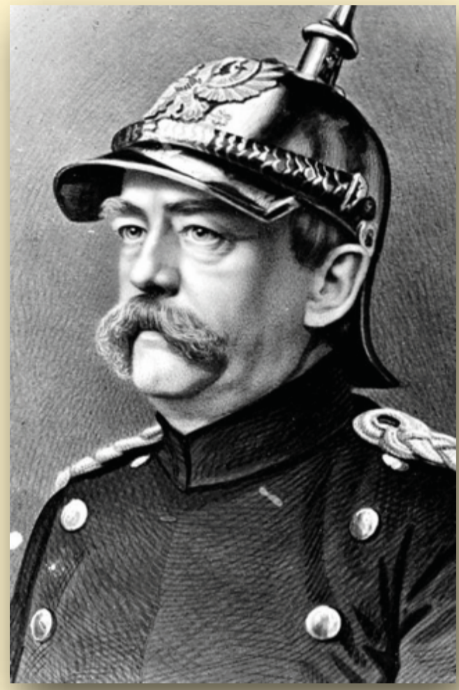
Otto von Bismarck

La Germania dal punto di vista politico attraversava un momento particolarmente difficile. Con Otto von Bismarck (1815-1898) ebbe inizio il movimento del Kulturkampf, e per la Chiesa si scatenò un tempo di prova e di persecuzione. Molti cattolici abbandonarono la fede e aderirono all'ideologia di Stato. Tutti questi avvenimenti non lasciarono indifferente il giovane Giovanni Battista Jordan.