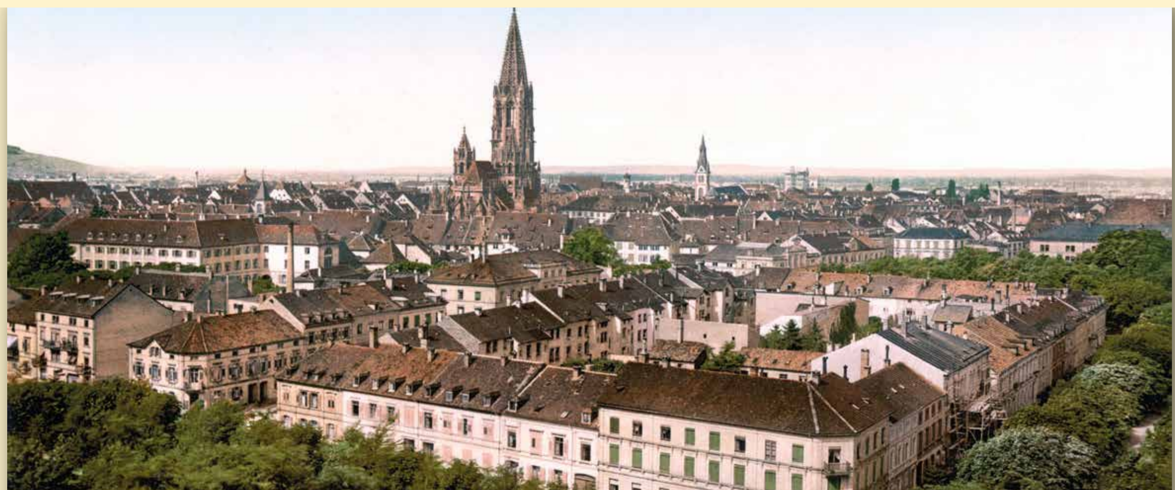
Friburgo - Germania