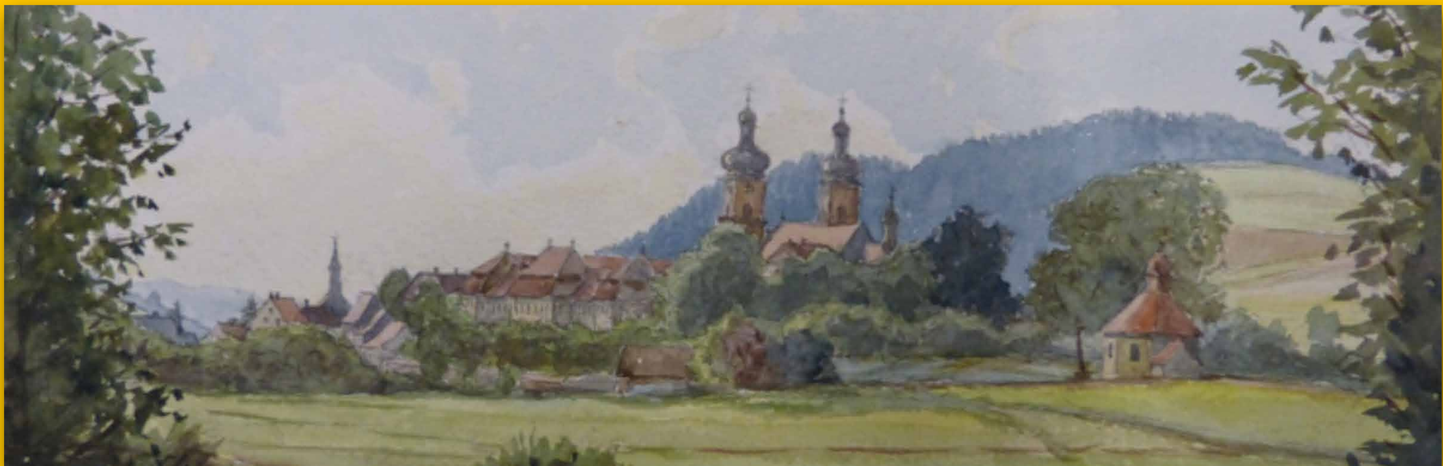
Seminario di St. Peter

Le avverse condizioni della vita negarono a G.B. Jordan la possibilità di studiare al momento giusto, però dall'altra parte gli diedero la possibilità di fortificare la sua vocazione e successivamente impegnarsi con diligenza e talento negli studi soprattutto nell'apprendimento in modo veloce delle lingue, allargando così la sua visione del mondo e della Chiesa, sempre più bisognosa di rinnovamento. La partecipazione ai Congressi Cattolici gli permise di entrare in contatto con molte personalità con le quali si confrontava volentieri.