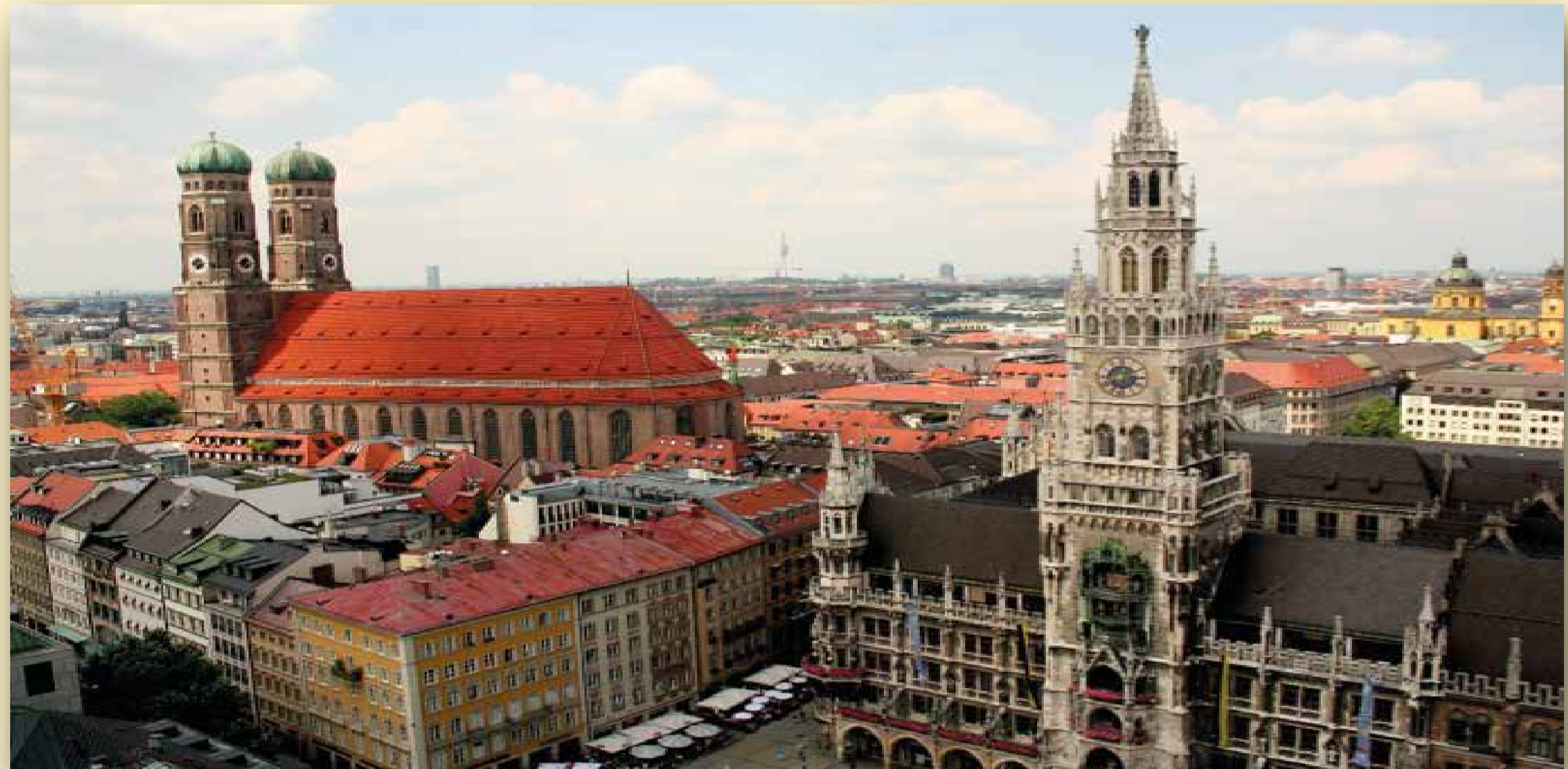
Monaco di Baviera - Germania

Nel "Congresso Cattolico" nella città di Monaco, diventò amico di San Arnold Janssen , Fondatore dei Missionari del Verbo Divino.