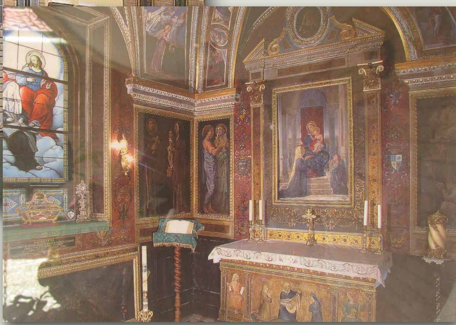
Cappella Santa Brigida - Roma