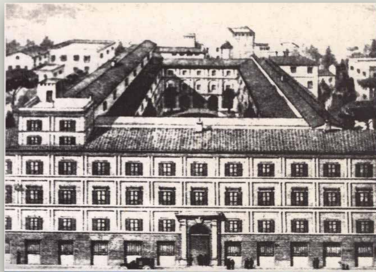
Disegno di Palazzo Cesi - Roma - fine '800