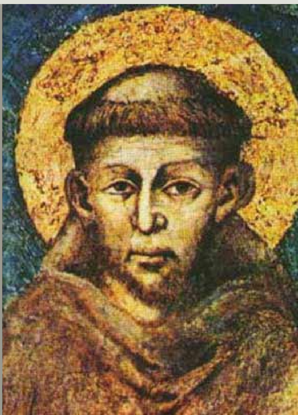
S. Francesco d'Assisi dipinto di Giotto