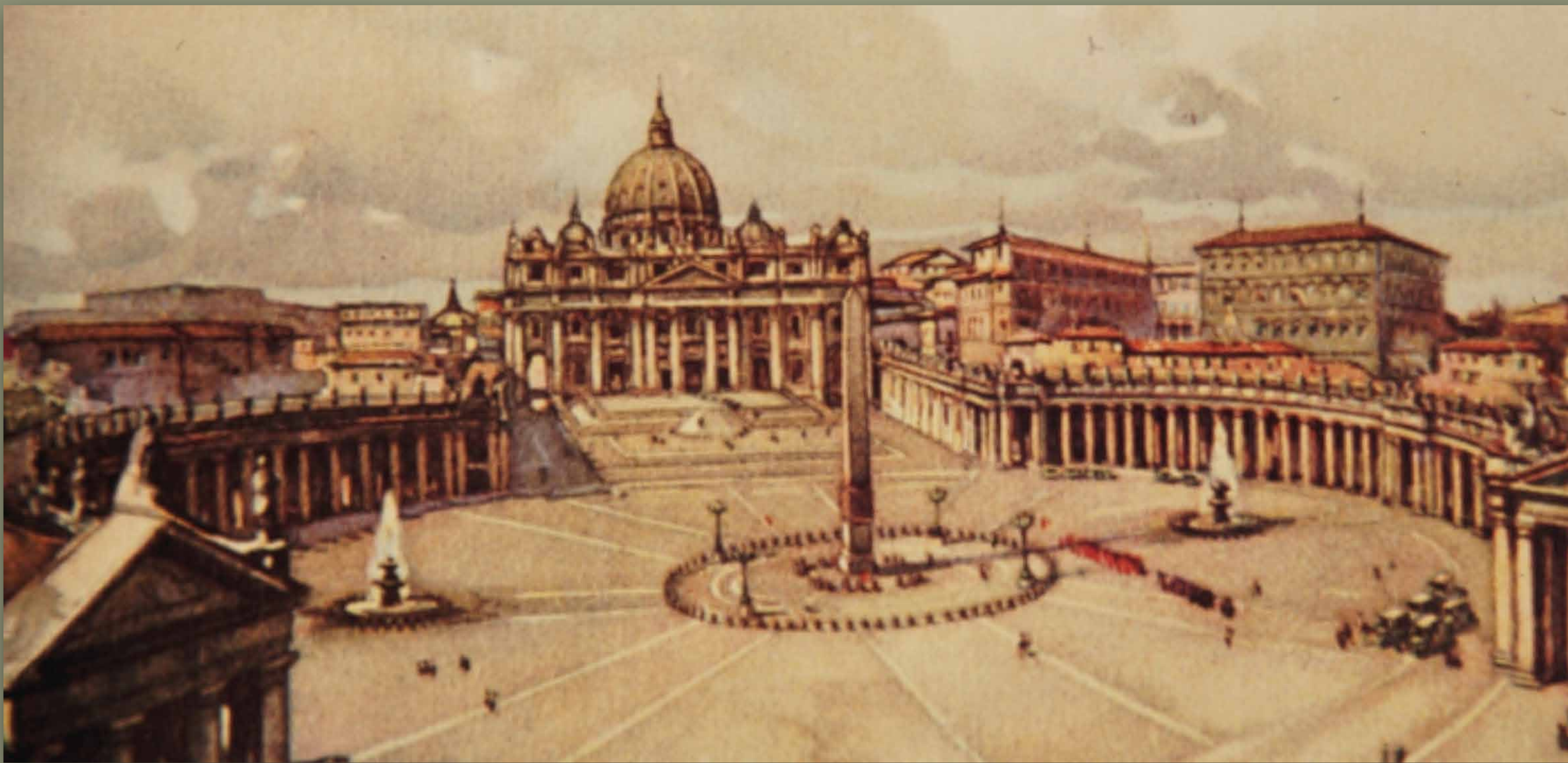
Dipinto di Piazza San Pietro - Roma

Ben consapevole che il cammino da seguire non sarebbe stato facile, e ben cosciente che la croce, come certificato d'autenticità dell'opera divina, diventerà la sua compagna di viaggio fino al termine della sua vita, confermò definitivamente la sua scelta di vita consacrandosi e abbracciando la vita religiosa secondo il carisma ricevuto.