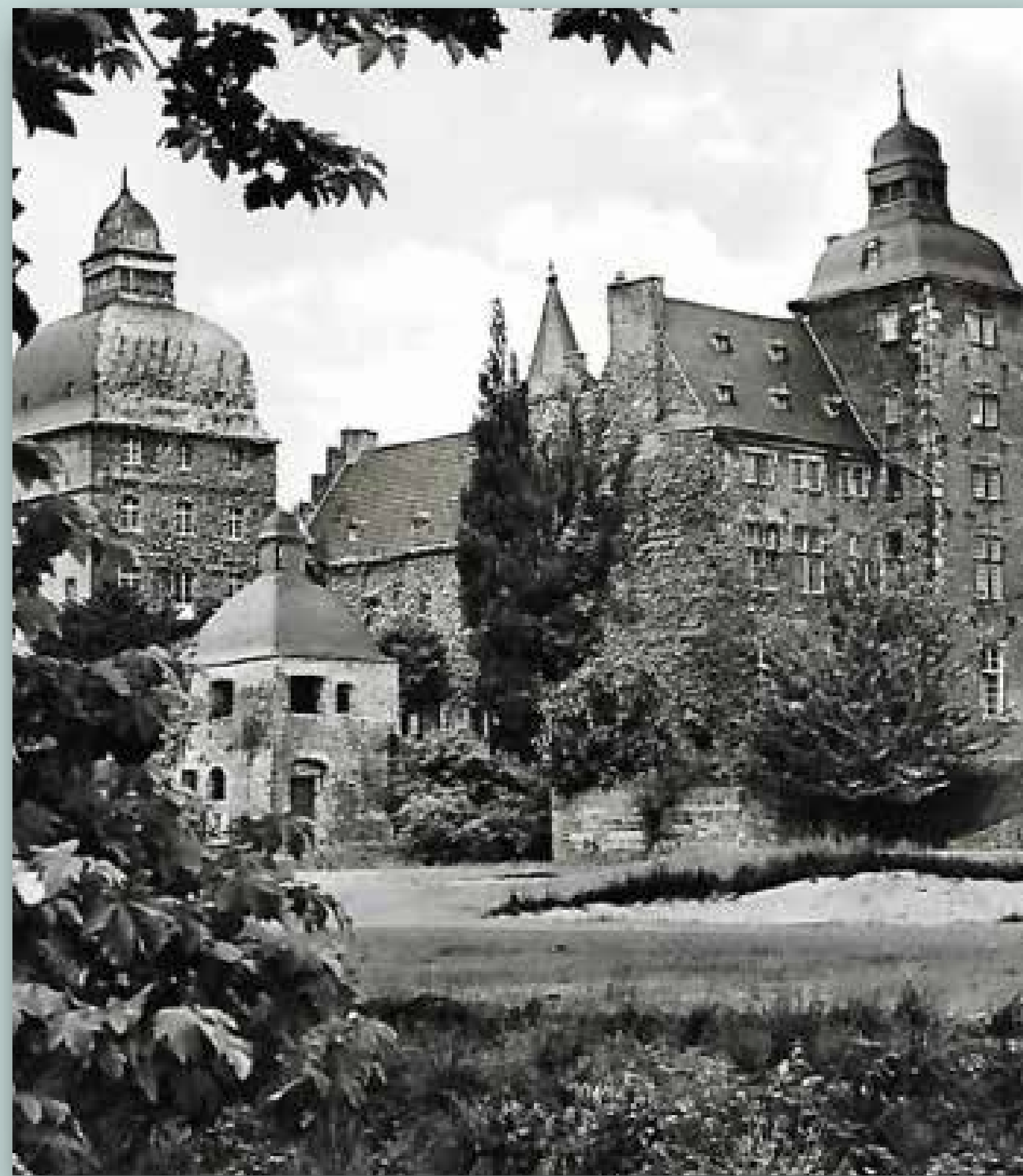
Castello di Myllendonk