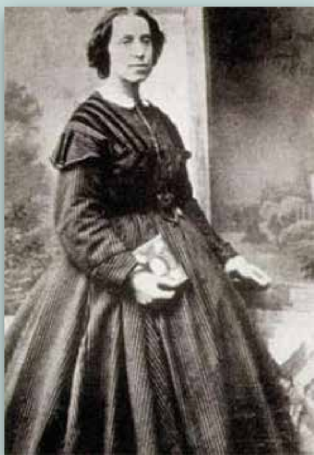
Therese von Wüllenweber