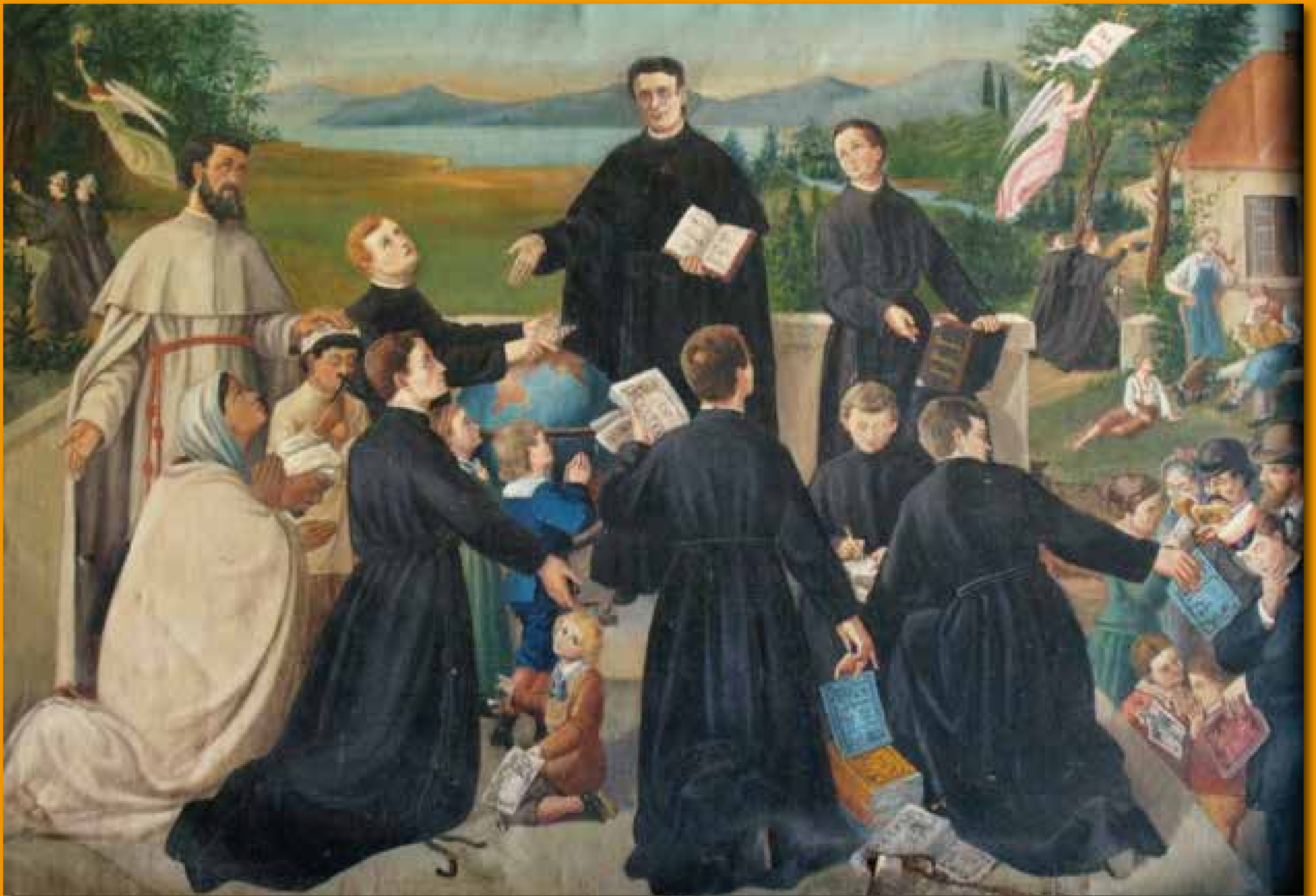
Dipinto di Fratel Egidio Röder sull'invio dei Primi Missionari

Una delle convinzioni di Francesco Jordan era che "le opere di Dio fioriscono solo all'ombra della croce." Dopo tanti sacrifici e tante defezioni a causa degli interventi della Chiesa, l'opera fiorì e assunse la missione di annunciare la salvezza, seminando germi di vita e di speranza in ogni luogo della terra.